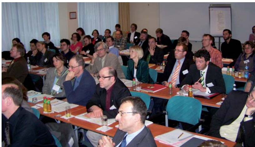
Workshop „Emissionsbilanzierung erneuerbarer Energien“, im März 2009 in Dessau-Roßlau

Die verfeinerte Methodik wurde auf einem Workshop im März 2009 vorgestellt und mit der Arbeitsgruppe Erneuerbare Energien-Statistik (AG EE-Stat), der Arbeitsgemeinschaft Energiebilanzen sowie verschiedenen wissenschaftlichen Institutionen und Verbänden diskutiert. Durch detaillierte Berücksichtigung der Vorketten und Substitutionsbeziehungen konnte ein breit akzeptiertes Datengerüst geschaffen werden, das auch für künftige Analysen herangezogen werden soll.